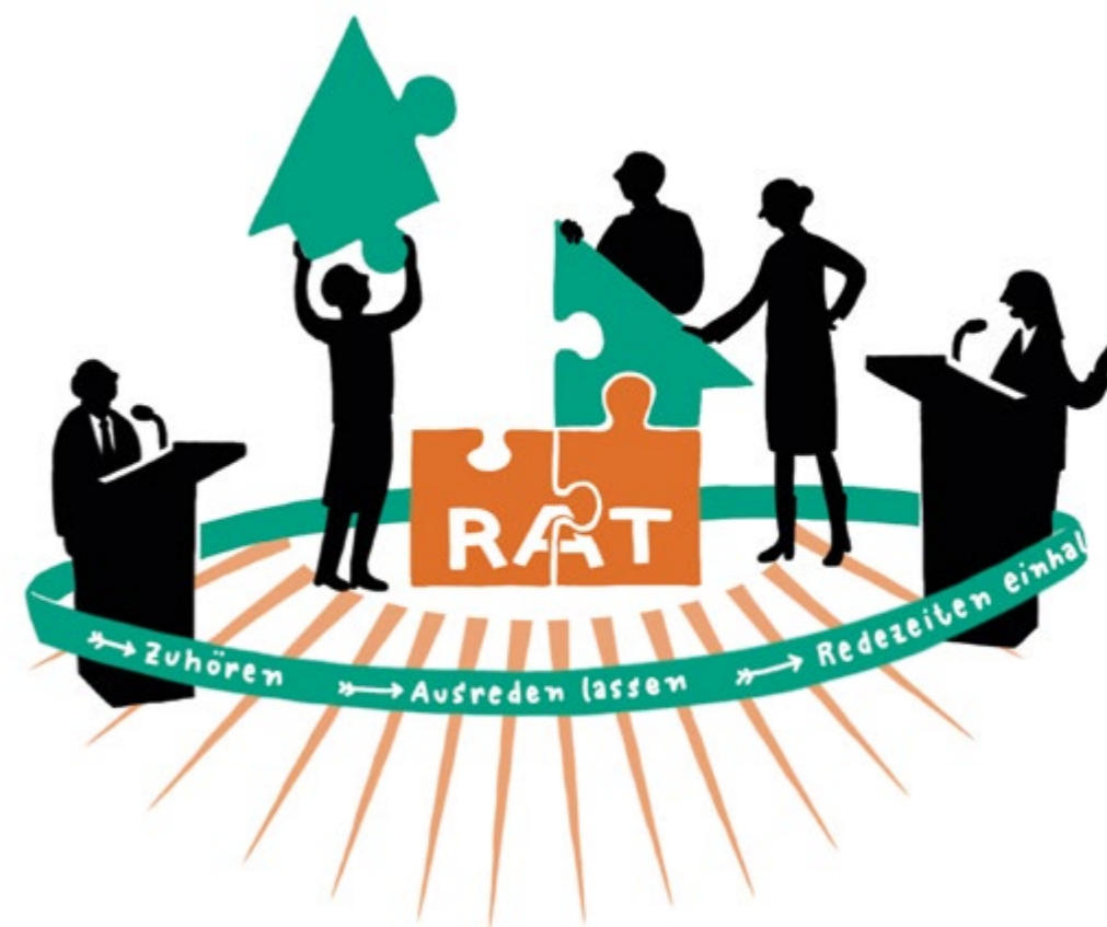
Abbildung 6 Die Diskussionskultur – eine Aufgabe für die Demokratie

Unter den Befragten herrscht so etwas wie ein Ethos des Ertragens. Probleme und Belastungen werden mit sich selbst ausgemacht und häufig einfach erduldet oder zu ignorieren versucht. Dieser Umgang trägt dazu bei, Kommunalpolitik zu individualisieren und gesellschaftliche