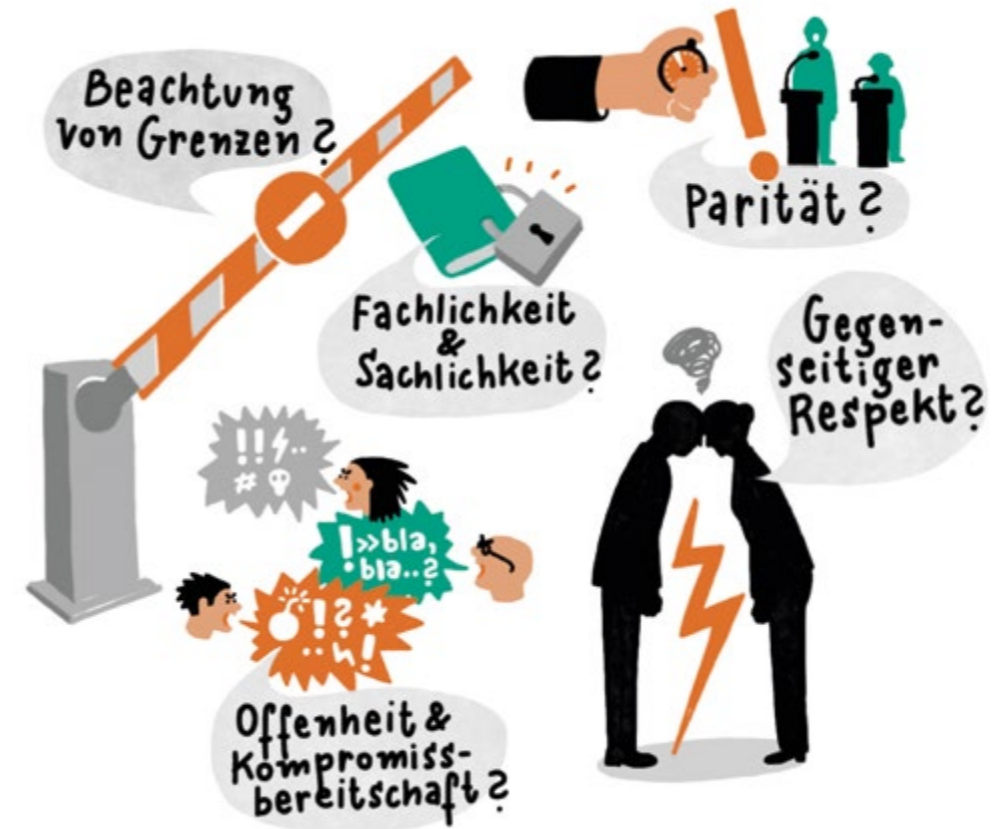
Abbildung 4 Bewertung der Diskussionskultur im Rat

Auf Basis der Tiefeninterviews mit den Ratsmitgliedern wurde in der vorliegenden Studie ein Modell der Diskussionskultur entworfen, welches in Anlehnung an das Konzept der Deliberation von Habermas und den Diskursqualitätsindex nach Steiner et al. erfolgte. Dieses Modell erfasst die Perspektiven und Erfahrungen der Ratsmitglieder und ermöglicht so einen guten Rahmen, die Qualität der kommunalpolitischen Debatte zu analysieren. Neben der Definition von Grenzüberschreitung in Diskussionen wurden vier weitere Dimensionen der Diskussionskultur herausgearbeitet, die der vorliegenden Studie als Grundlage dienen: gegenseitiger Respekt, Fachlichkeit und Sachlichkeit, Offenheit und Kompromissbereitschaft sowie Parität. In diesem Kapitel geht es nun auf Basis dieses Modells um die Beantwortung der Frage: Wie steht es um die Qualität der Debatten auf kommunaler Ebene? Genauer: Wie bewerten die Ratsmitglieder diese innerhalb ihres Gemeinde- oder Stadtrats sowie in der eigenen Fraktion?