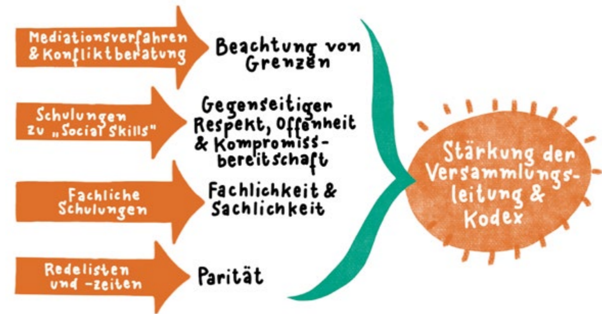
Abbildung 7 Strategien und Lösungsansätze zur Verbesserung der Diskussionskultur

Was im Zuge der Interviews ebenfalls deutlich wurde: Auch wenn die meisten Befragten ihre Probleme im Verhalten einzelner Personen verorten und individuelle Lösungsstrategien anwenden, ähneln sich die Problemlagen. Zu erklären ist dies durch allgemein-strukturelle Bedingungen für Kommunalpolitik wie die Mandatierung als Ehrenamt, fehlende Zeit und fehlende Schulung in