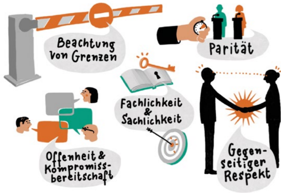
Abbildung 3 Die Dimensionen der Diskussionskultur

»Wenn es abseits des thematisch Politischen einfach zu persönlich und verletzend wird, dann ist der Diskurs schon überschritten. Also ich meine, man kann ruhig hart diskutieren. Aber es sollte halt alles noch in dem Bereich ablaufen, wo man dem anderen noch in die Augen schauen kann.«